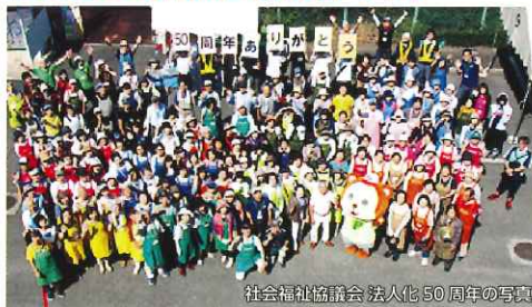
社会福祉協議会 法人化50周年の写真